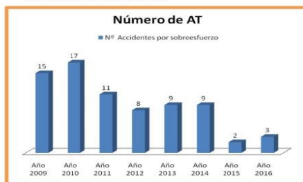
Figura 2. Numero de accidentes por Sobreesfuerzo.