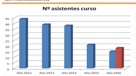
Figura 1. Numero de asistentes al curso.